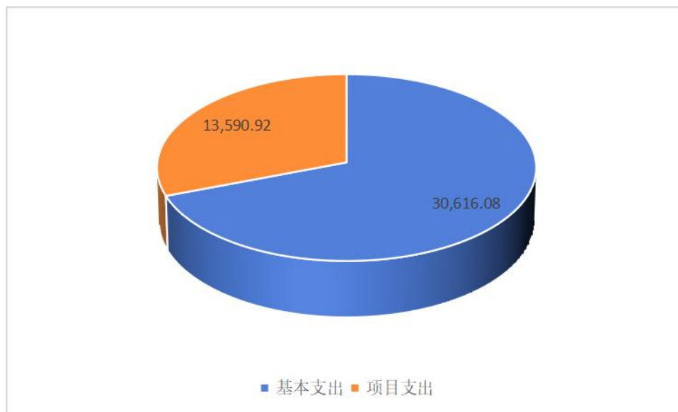
图 3：支出决算构成情况（按支出性质，单位：万元）

本单位 2022 年度本年支出合计 44,207.00 万元，其中：基本支出 30,616.08 万元，占 69.26%；项目支出 13,590.92 万元，占 30.74%。如图所示：