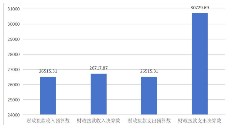
图 5：财政拨款收支预决算对比情况（单位：万元）

本单位 2022 年度一般公共预算财政拨款收入 26,717.87 万元,完成年初预算的 100.76%,比年初预算增加 202.56 万元,决算数 大于预算数主要原因是人员经费、项目经费增加;本年支出 30,729.69 万元,完成年初预算的 115.89%,比年初预算增加 4,214.38 万元,决算数大于预算数主要原因是主要原因是人员经费、项目经费增加。