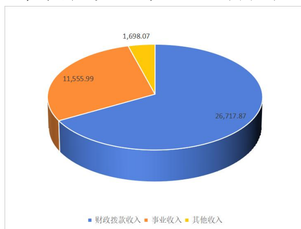
图 2：收入决算构成情况（单位：万元）

本单位 2022 年度本年收入合计 39,971.94 万元，其中：财政拨款收入 26,717.87 万元，占 66.84%；事业收入 11,555.99 万元，占 28.91%；其他收入 1,698.07 万元，占 4.25%。